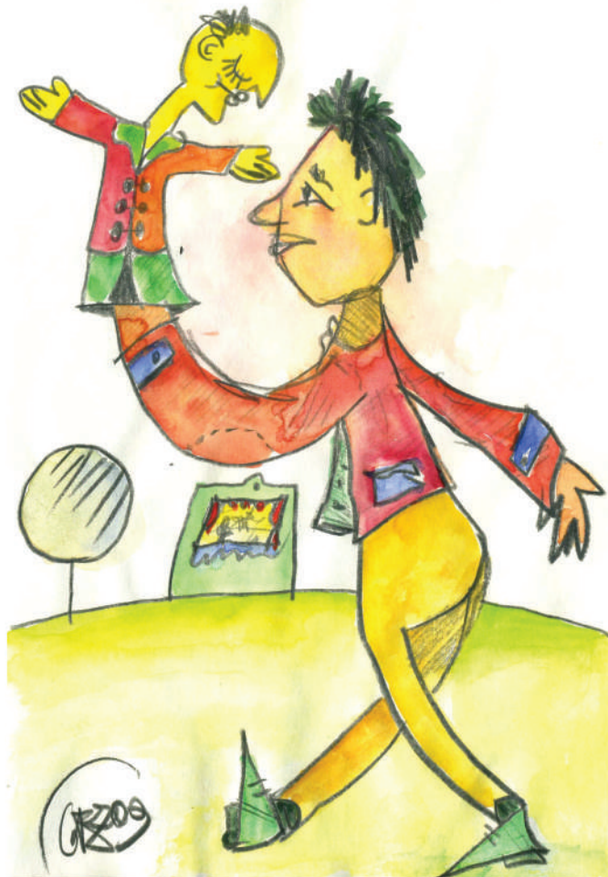
I disegni sono di Gianfranco Zavalloni. Ringraziamo per la collaborazione Stefania Fenizi

Info Istituto Musei Comunali - tel. 0541.624703 www.metweb.org - FB: Istituto Musei Comunali Santarcangelo